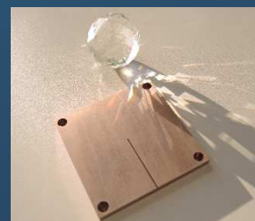
75×75×t6 mm コールドプレートトップ