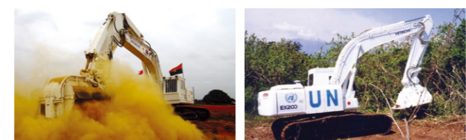
対人地雷除去機

株式会社日建が1995年に開発を始めた地雷除去機のビットとして、東邦金属は1997年11月に、森林伐採・木材切削を目的とした農業開発用ビット「プッシュマイナカッター」としてスタートし、1998年3月に、国内・アフガニスタンでテストして良好な結果を得ました。1998年6月には地雷除去用ビットとして、実装テストを進めました。1999年11月に、読売新聞にて「日本初地雷除去機の開発に成功した」との記事が掲載され、日本政府がODA(政府開発援助)の一環として、カンボジア政府と国連が設立した「カンボジア地雷対策センター」に、対人地雷除去機を2台贈与しました。その後、幾多の改良を重ね、現在も、カンボジア、アフガニスタン、アンゴラなどにおいて活躍中です。地雷が除去された土地は平和な姿を取り戻し、子供たちの元気な笑い声が今日も聞こえてきます。