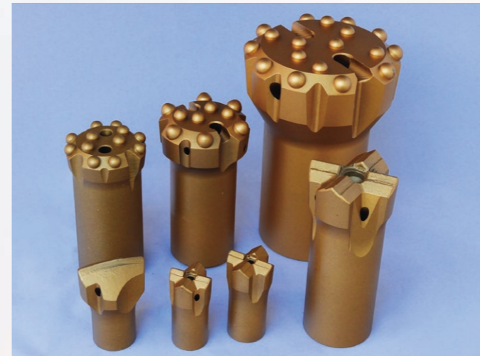
△ 土木建設・鉱山用ビット Bits for construction and mining

土木工事、碎石場、爆砕工事、トンネル掘削等、さく岩機を用いた掘削に使用されるビットです。様々な地質、掘削条件に対応すべくボタンタイプ、クロスタイプ等を取り揃えています。