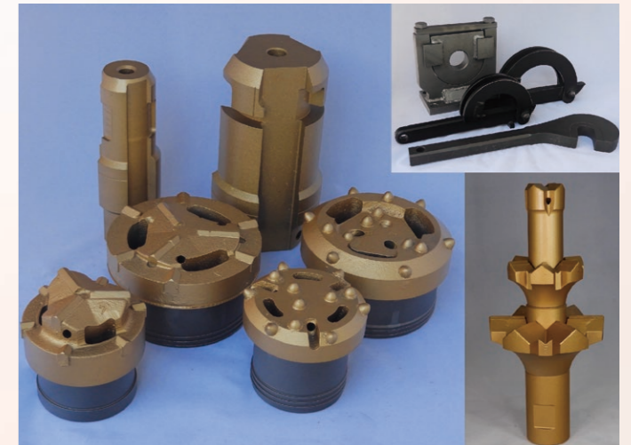
△ AGF用資材 Materials for AGF

Cemented carbide tools are widely used in mining, civil engineering, and other applications that require resistance to wear and corrosion.