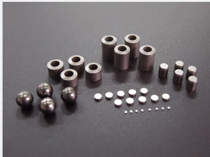
△ タングステン重合金 Tungsten heavy alloy

Tungsten heavy alloy is used as a weight and radiation shielding material. Because it has a large density, it can be miniaturized from an existing parts, and it is also used as an alternative material from lead.